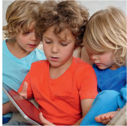
Tijdens het spelen raken de hoofden elkaar en kan hoofdluis zich verspreiden.

Hoofdluis heeft niets te maken met wel of niet schoon zijn. Het kan iedereen overkomen. Hoofdluizen lopen via het haar over van hoofd naar hoofd. Hoofdluizen zoeken graag een warm plekje op; bijvoorbeeld in het haar achter de oren, in de nek of onder een pony. Kinderen krijgen gemakkelijk hoofdluis, omdat tijdens het spelen de hoofden elkaar soms raken. Hoofdluizen verspreiden zich ook makkelijk bij pubers. Dat kan bijvoorbeeld gebeuren bij het knuffelen, samen selfies maken of bij elkaar op de mobiel kijken.